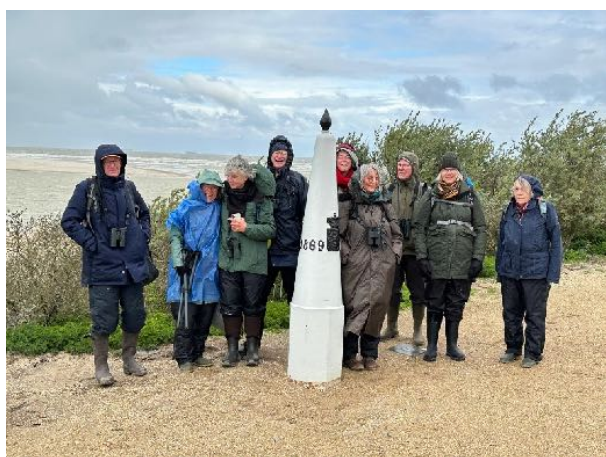
Grenspaal bij 't Zwin, gemaakt door Hans Boekhout

Het is dus niet verwonderlijk dat het weer er een belangrijke rol in speelt.