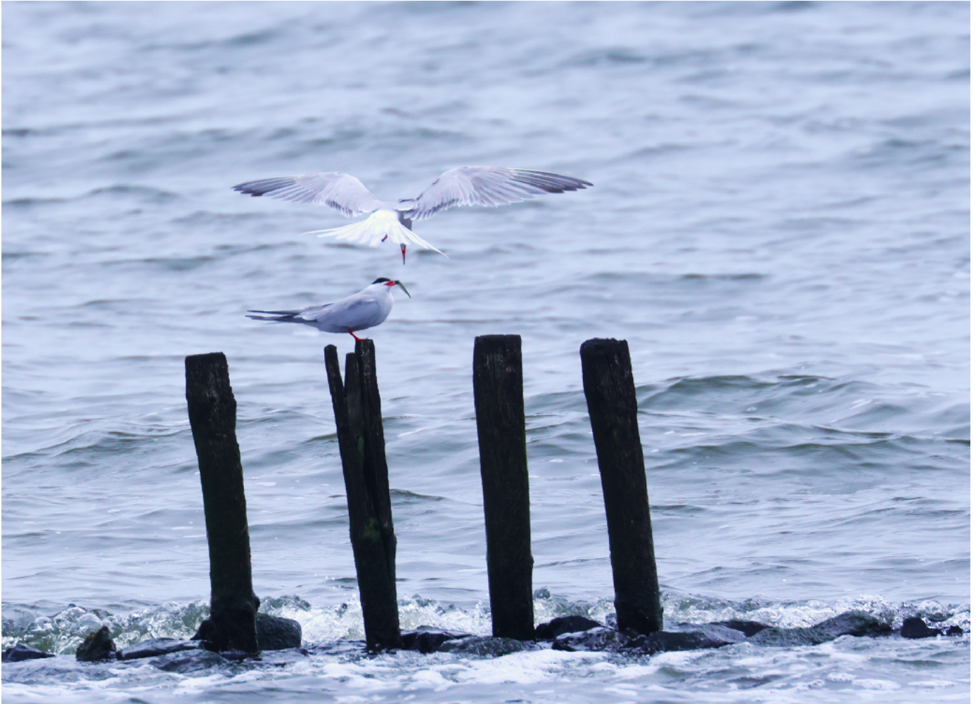
Visdiefjes. Foto: Huub Lakerveld, genomen op 5 mei 2024 in de Weevers Inlaag op Schouwen-Duiveland

Wat een prachtige foto! De compositie is heel mooi: strak, de palen, de lijnen van de vleugels van de bovenste visdief.