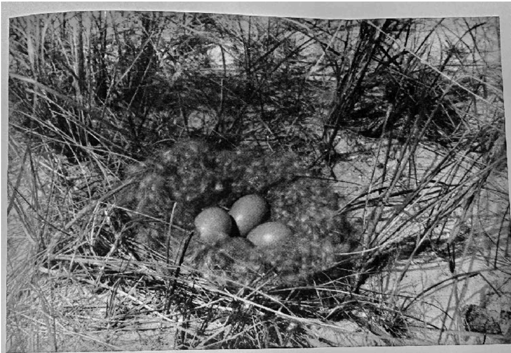
Nest van de Eidereend op Vlieland. De vier olijfgroene glanzende eieren liggen in een dikke laag van donkerbruin dons