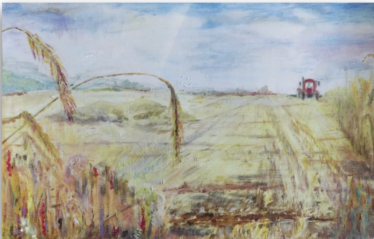
Werk van Sonja Hanedoes